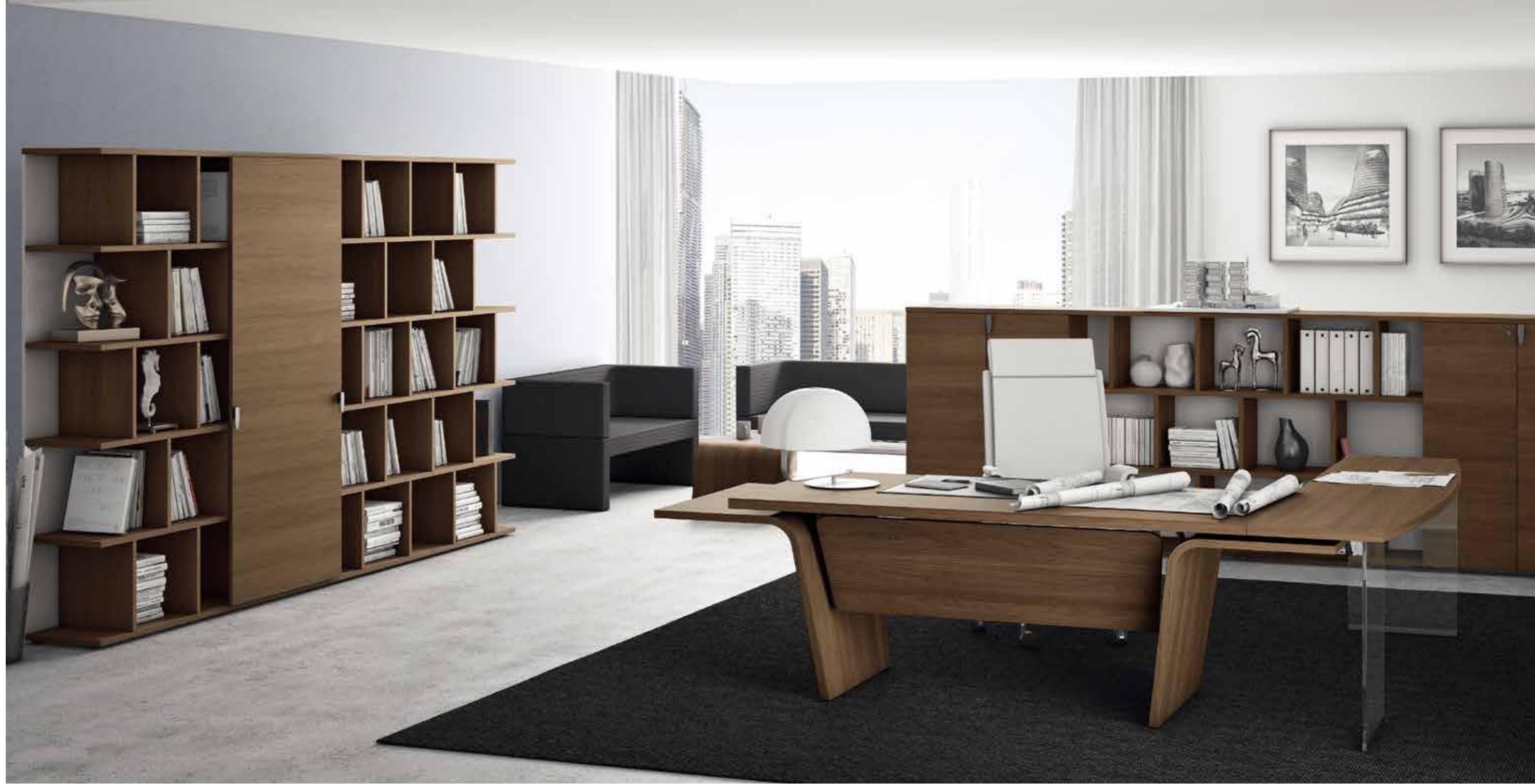
La solidità del legno e la dinamicità delle curve per una postazione ergonomica. Robustness of wood and sinuosity of curves for an ergonomic workspace